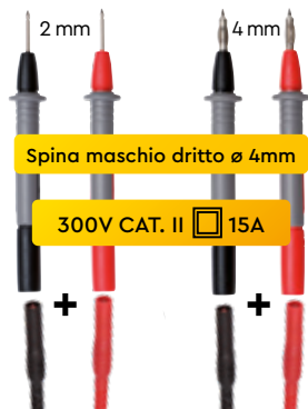
CAVI + PUNTALI Ø 2 mm cod. AMRP01295474Z