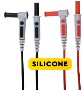
CAVI SICUREZZA cod. AMRP01295453Z

FLESSIBILI Spina maschio: Ø 4mm / L=8,5cm Corrente max 10A Protezione elettrica: 33VAC / 70VDC Quantità: 3R / 3N (da utilizzare con cod. P01295475Z)