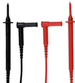
CAVI DI SICUREZZA cod. AMRP01295456Z