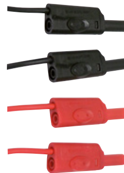
CAVI DI SICUREZZA cod. AMRP01295290Z