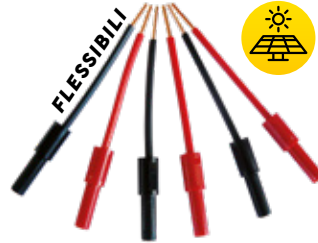
TEST POINT cod. AMR11-0000-276

FLESSIBILI Spina maschio: Ø 4mm / L=8,5cm Corrente max 10A Protezione elettrica: 33VAC / 70VDC Quantità: 3R / 3N (da utilizzare con cod. P01295475Z)