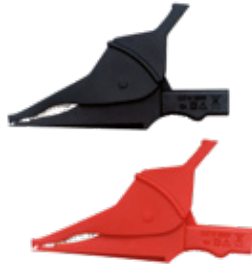
PINZE A COCCODRILLO cod. AMRP01295457Z

2 pinze coccoodrillo – CAT. IV 2 puntali – CAT. IV 2 puntali Ø 4mm – CAT. II 2 cavi 90°/dritto 1,5m – CAT. IV