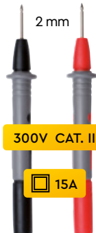
PUNTALI DI MISURA Ø 2 mm cod. AMRP01295460Z